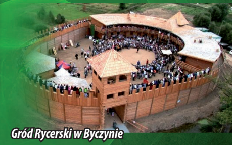
Gród Rycerski w Byczynie