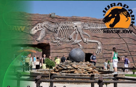
Jurapark w Krasiejowie

Opole • Krasiejów • Krapkowice • Nysa • Glucholazy • Jamokówek • Góra św. Anny