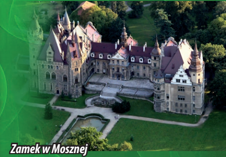
Zamek w Mosznej