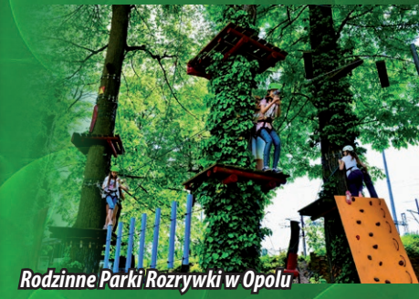
Rodzinne Parki Rozrywki w Opolu